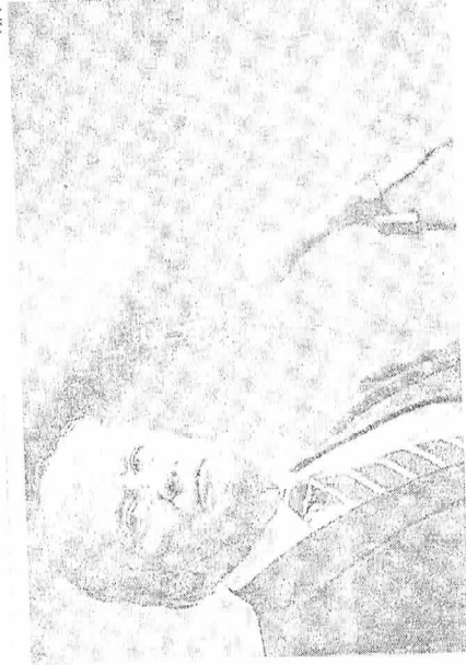
Presidente dos Estados Unidos, Donald Trump