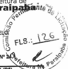
TABELA SEINFRA Nº 24.1 BDI DE 25%

LOCAL: DIVERSAS RUAS DA SEDE, DOS DISTRITOS E DAS LOCALIDADES DO MUNICÍPIO DE PARAIPABA