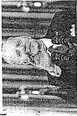
BIDEN tem elevado o tom dos ataques a Putin