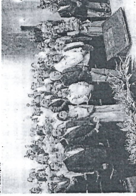
SINDICATO da Construção no Ceará comemorou 80 anos ontem, 18

SAMUEL PIMENTEL samuel.pimentel@opovo.com.br