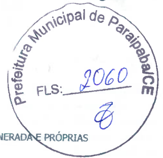
TABELA: SEINFRA 027.1 DESONERADA E PRÓPRIAS BDI: 25,79%