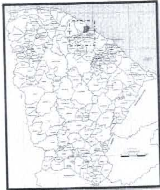
Localização do Município