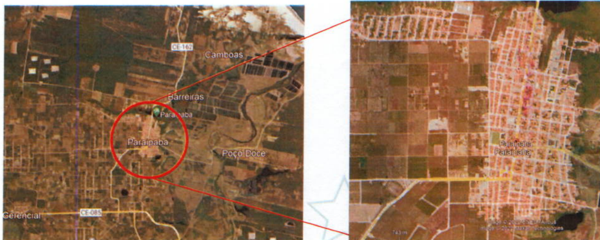
Figura 1 – Localização do Município / Situação do Município