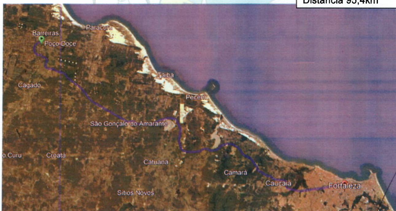
Figura 2 – Acesso ao município