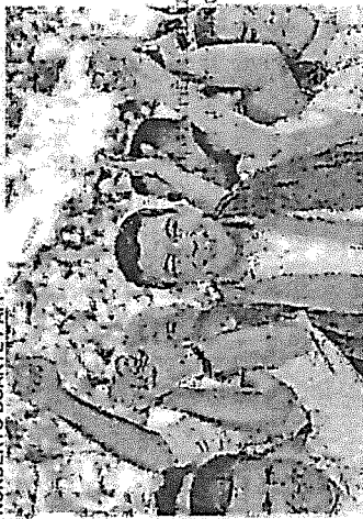
SANTIAGO PEÑA tomará posse em agosto como presidente do Paraguai