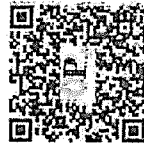
Aponite a câmera do celular e acesse mais notas exclusivas de Érico Firmo.

Os desgastes e polêmicas de início de mandato ameaça a popularidade do presidente particularmente nesse setor hesitante e naturalmente crítico. O que o Ipec mostra é que, se houve estrago, ele não é de grandes dimensões.